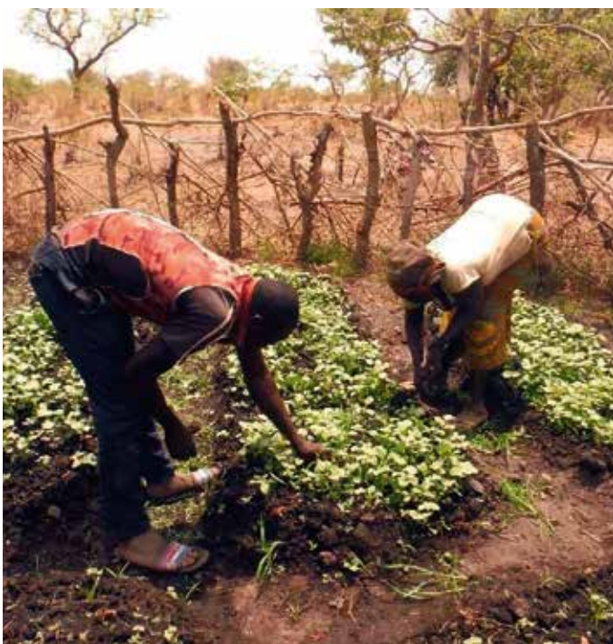
Orticoltori di Laounangra e Niankollao

DAI IL TUO CONTRIBUTO FACENDO UN VERSAMENTO SUL CONTO CORRENTE BANCARIO "Noi per il Ciad" IT10V081783494000018165876