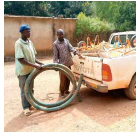
Depositi di materiale di produzione vegetale presso il magazzino nella parrocchia di Gagat

Rimane da evidenziare come le condizioni ambientali (es. siccità prolungata, la presenza di locuste, trasporto complesso) rendono le condizioni di lavoro più difficili.