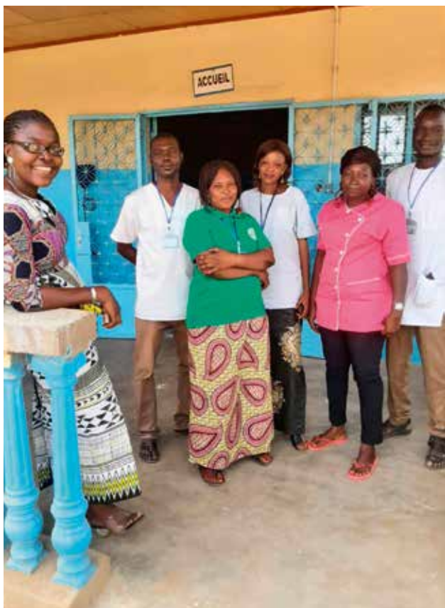
Gruppo di lavoro