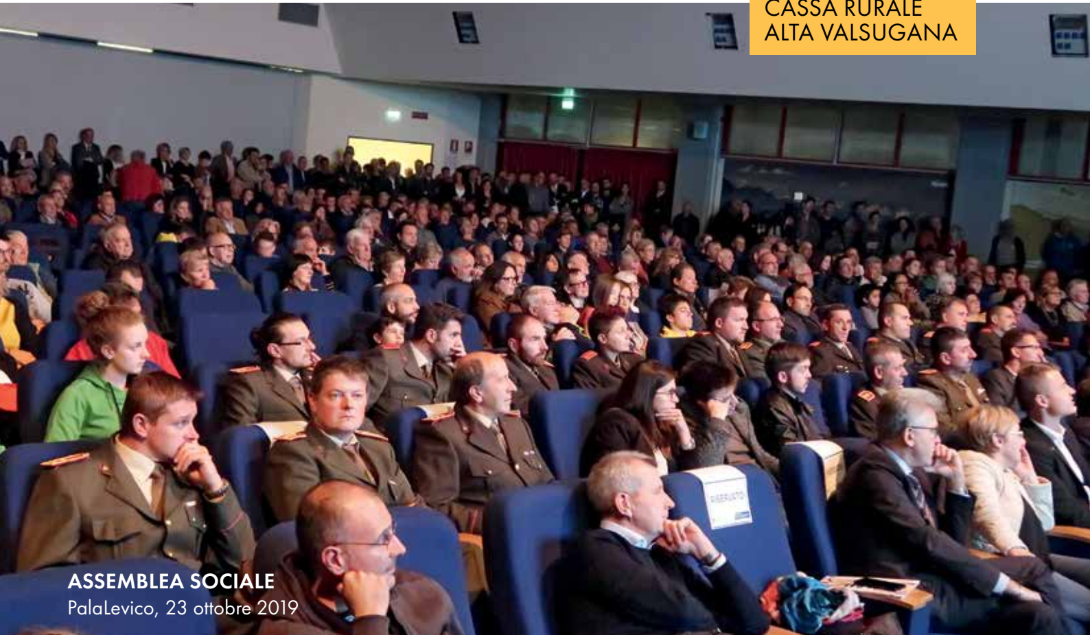
ASSEMBLEA SOCIALE PalaLevico, 23 ottobre 2019

RIVISTA TRIMESTRALE DELLA CASSA RURALE ALTA VALSUGANA