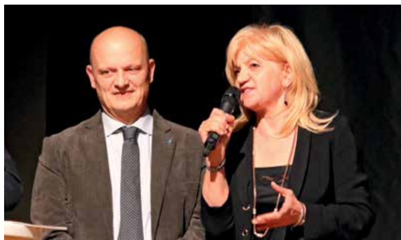
Alcuni momenti della serata sul bilancio sociale della Cassa Rurale Alta Valsugana dello scorso 23 ottobre