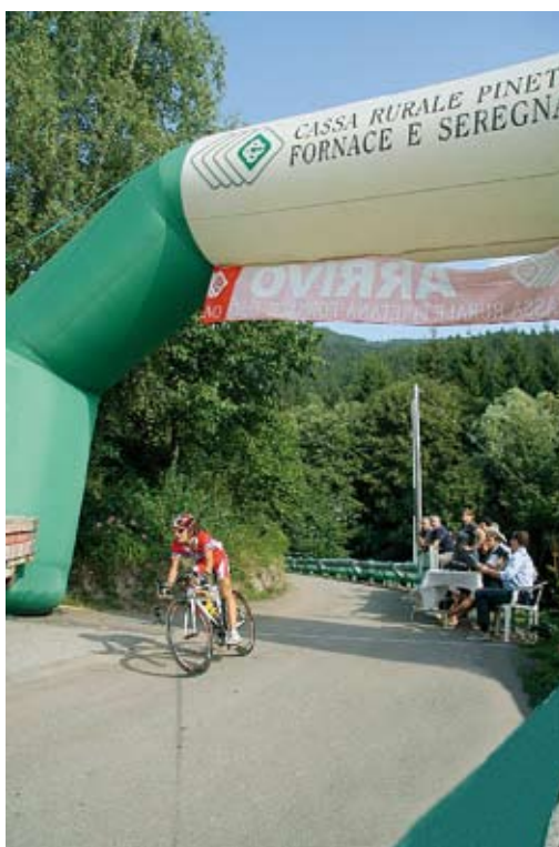
In questa immagine l'arrivo di uno degli allievi impegnati nel Trofeo Canè in Fiore. Dopo aver concluso la sua fatica, interamente in salita, supera lo striscione di arrivo della Cassa Rurale Pinetana Fornace e Seregnano.

Alle porte dell'autunno è stato l'Ice Rink a ospitare una prova riservata ai biker. Anche qui non è mancata la partecipazione di qualità per una prova che ha impegnato, per una intera giornata, lo staff organizzativo che ha potuto contare sull'appoggio della nostra Cassa Rurale.